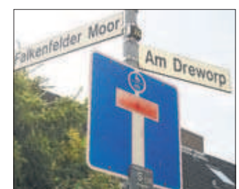
Sackgassen-Schild mit Aufkleber.

Am Dreworp/Ecke Falkenfelder Moor hängt dieses Schild tatsächlich bereits. Für Autos endet die Straße Falkenfelder Moor in einem Wendehammer, für Fußgän-