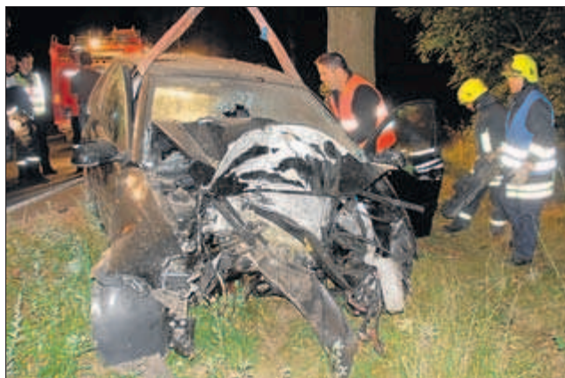
Die Retter hatten keine Chance: In der Nacht zu Sonntag kam ein 19-Jähriger bei Salem ums Leben.

Allein am vergangenen Wochenende wurden die Retter zu zwei dramatischen Einsätzen gerufen: Ein 19-jähriger Besucher des Ratzeburger Bürgerfestes rast auf dem Heimweg gegen einen Baum und stirbt. Gerade noch mit dem Leben davon kommen zwei 19-Jährige auf der Landstraße 87 bei Ratzeburg: Auch sie sind angetrunken, viel zu schnell unterwegs, krachen gegen einen Chausseebaum. Ihr Fahrzeug fängt Feuer. Ohne das beherzte Eingreifen eines