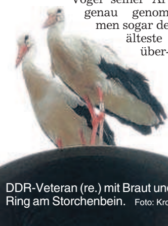
DDR-Veteran (re.) mit Braut und Ring am Storchlein.

Den halten bekanntlich weder Ochs noch Esel auf, aber dass nun ein Storch die Fahne hochhalten soll, entbehrt nicht einer gewissen Ironie. Der Vogel hat schließlich Jahr für Jahr in Afrika überwintert. Er ist also entweder Republikflüchtling, oder er genoss Privilegien. Wenigstens kann man ihm keine West-Agitation vorwerfen: Klappern gehört bei ihm zum Handwerk. nes